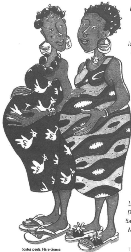
Contes peuls. Mère-Lionne

Les livres traitant de l'Afrique sont toujours présents en grand nombre chaque année dans l'édition française. Qu'ils abordent un aspect particulier relatif à ce continent ou qu'ils y soient entièrement consacrés, qu'ils considèrent l'Afrique uniquement comme cadre du récit ou, au contraire, comme thème central, que leurs auteurs soient africains ou non, tous ouvrent aux lecteurs différentes portes d'accès à ces pays et à leurs cultures.