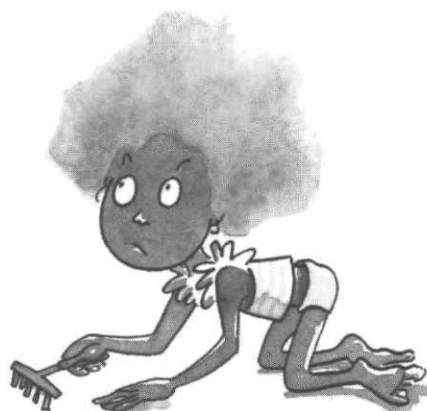
Rien du tout