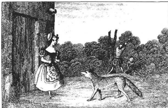
« Contes des fées en estampes », illustration sur bois non gravée, vers 1840.

Le Théâtre du Loup blanc a créé un spectacle de marionnettes Le placard , à partir de l'album de Mercer Mayer Il y a un cauchemar dans mon placard (Gallimard).