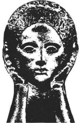
Prix catalan d'illustration.

• Règlement à demander à l'Association pour la promotion du livre pour enfants, 22 Crêts-de-Champel, 1206 Genève, Suisse.