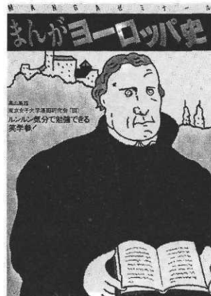
« Vie de Luther » réalisée par un collectif d'étudiantes. Gakken, 1984.