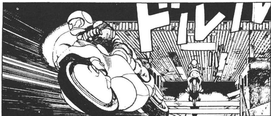
« Akira », par Otomo Katsuhiro.

habituellement de mise. Sur ce point précis, les BD japonaises sont un témoignage sociologique fascinant. On y retrouve dramatisées et mises en question les valeurs les plus fondamentales de la civilisation nipponne : importance du conformisme social, exaltation du travail comme moyen de réalisation personnelle. Chacune dans leur sphère, les bandes dessinées pour garçons ou filles, « salary-men » ou femmes au foyer, abordent ces questions, pour les dissoudre dans le romantisme lacrymal ou l'iconoclastie vengeresse. Car c'est une autre particularité des « mangas » : ils sont lus par presque toutes les couches de la société. Cette universalité est récente, tout comme l'implantation des bandes dessinées elles-mêmes, qu'on peut dater des années trente (2) , avec la publication des strips américains classiques ( Bringing Up Father , Blondie , etc.), qui furent immédiatement adoptés, et copiés. Le régime militariste comprit le parti que l'on pouvait tirer de ce moyen d'expression pour la propagande et l'utilisa massivement dans son effort de guerre.