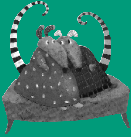
Dix, ill. V. Radunsky, Seuil Jeunesse