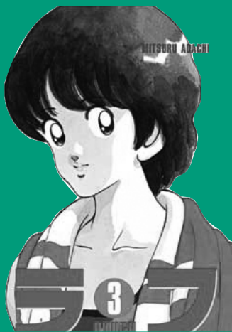
Rough, dess. M. Adachi, Glénat