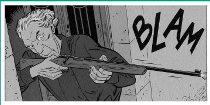
Un Petit coin de paradis, dess. A. Dodier, Dupuis