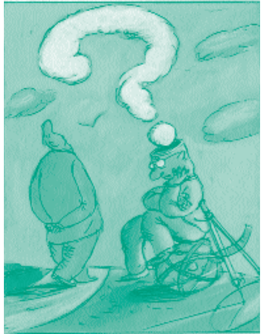
Petite histoire des religions , ill. D. Maja, Syros Jeunesse