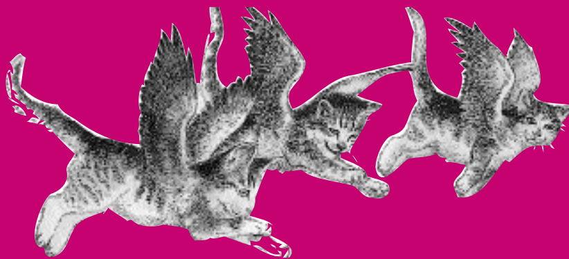
Les Chats volants, ill. S.D. Schindler, Gallimard Jeunesse