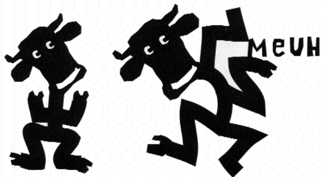
ill. Gérard Marty pour Griffon , in Griffon , n°196, mars-avril 2005