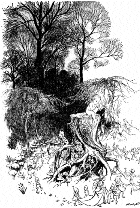
ill. Arthur Rackham : Peter Pan in Kensington Gardens , in Nous voulons lire ! , n°159, avril 2005