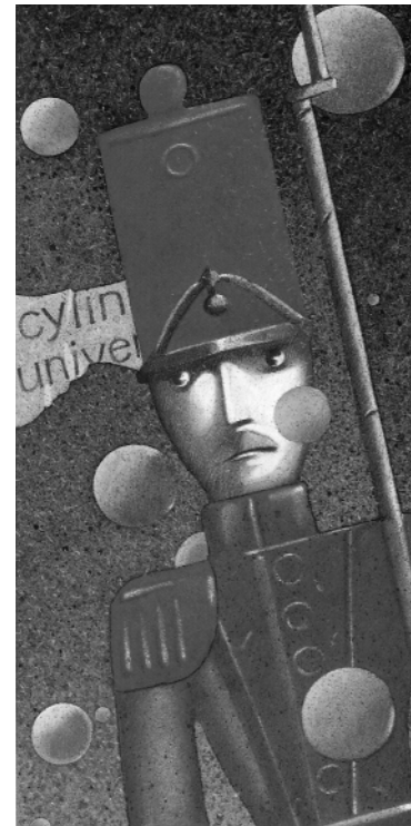
Le Petit Soldat de plomb , ill. G. Lemoine, Grasset-Monsieur Chat