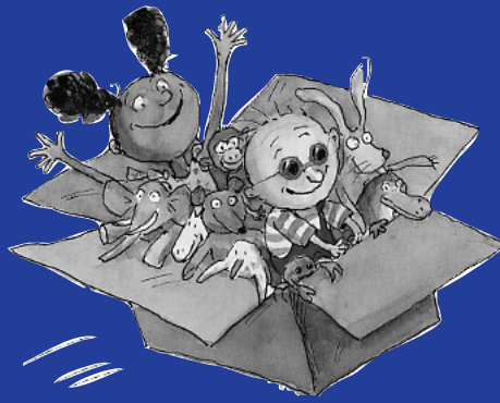
Popi, Bayard Jeunesse

de la nature. Enfin on retrouve une bande dessinée, Franky & Raoul, qui vient combler le vide laissé par le départ de César, le corbeau mascotte.