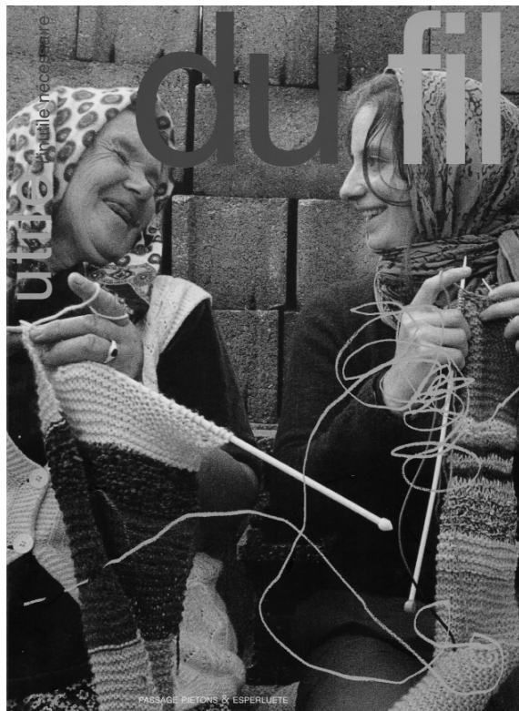
Utile, l'inutile nécessaire, n°1 : « Du fil », Passage Piétons & Esperluète