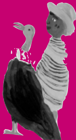
Yatiri et la fée des brumes, ill. M. Vautier, Albin Michel Jeunesse