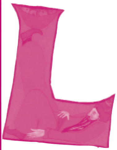
Devinettes turques, collage E. Huet, Grandir