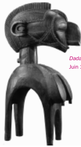
Dada, n°120, Juin 2006

en 1912 ?), la mode garçonne des années folles avec le portrait de la peintre Tamara de Lempicka (dont des tableaux sont exposés jusqu'au 16 juillet au musée des années 30 de Boulogne-Billancourt), et surtout un excellent dossier sur les mosquées, qui dresse à la fois un historique dans le contexte socio-religieux, fournit des plans architecturaux, et donne tout un vocabulaire très utile. Le n°104, juin 2006, aborde le futurisme et l'art florentin de la Renaissance.