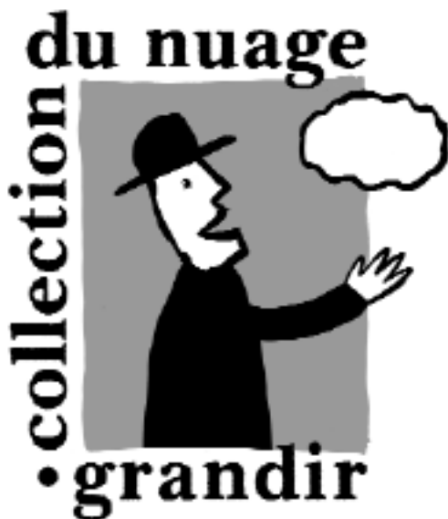
Simon sans nuit , © N. Bianco-Levrin, Grandir