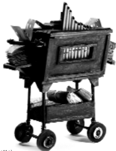
Le Machino (maquette)