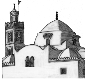
Bouqala : chants des femmes d'Alger, ill. R. Koraïchi, Thierry Magnier

Recension et analyse de 250 nouveautés de l'édition jeunesse, classées par genres : livres d'images, contes, premières lectures, textes illustrés, bandes dessinées, documentaires, CD-Roms, journaux pour enfants. Analyse d'ouvrages de référence.