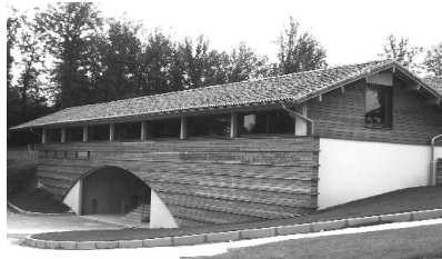
Inauguration de la médiathèque du Père Castor à Meuzac

Événements, rencontres et manifestations autour du livre pour enfants.