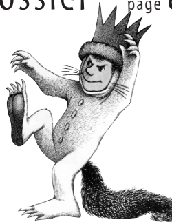
Max et les Maximonstres, ill. M. Sendak, L'École des loisirs