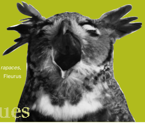
Sous l'œil des rapaces, Fleurus