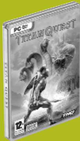
Titan Quest Iron Lore, THQ