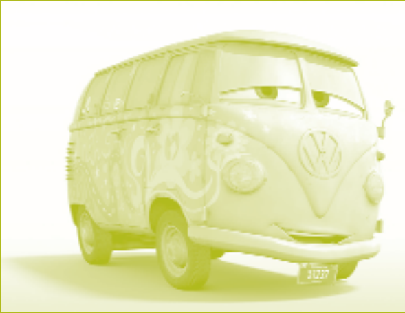
Cars, Rainbows studios, THQ, Disney-Pixar