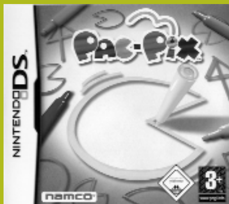
Pac-Pix, Namco, Nintendo