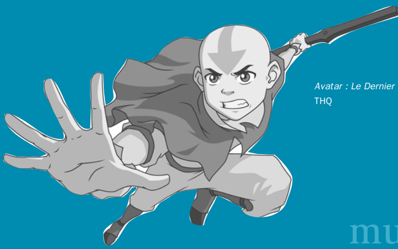
Avatar : Le Dernier maître de l'Air THQ