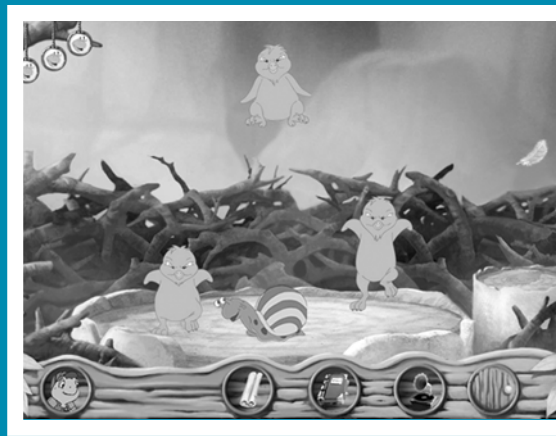
Franklin et le trésor du Lac Nelvana / Mindscape