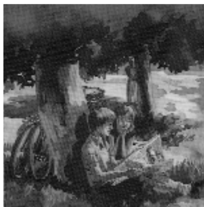
Ta photo dans le journal, Le Seuil