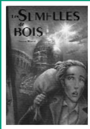
Les Semelles de bois, Grasset Jeunesse

deux enfants vont se mobiliser pour sauver et leur père et le couple parental... avec une aide tout à fait inattendue. C'est plein de rebondissements, de rythme, de drôlerie ! (N.D.)