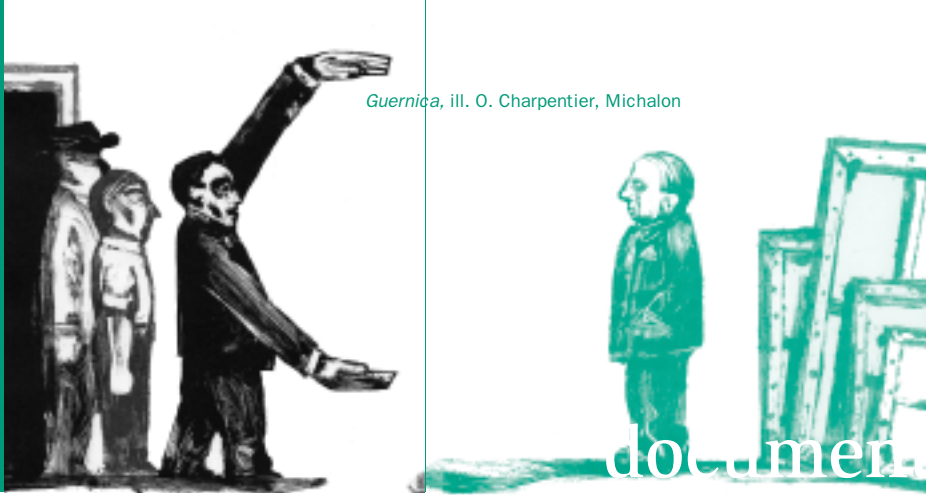
Guernica, ill. O. Charpentier, Michalon