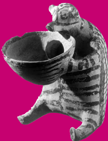
La Grèce antique : une terre de légende, Hachette Jeunesse / Musée du Louvre