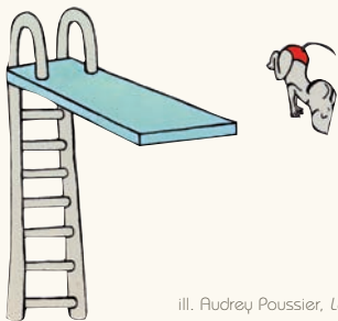
ill. Audrey Poussier, La Piscine , L'École des loisirs