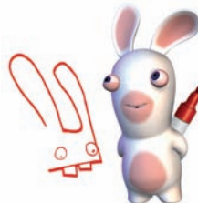
Rayman contre les lapins encore plus crétiens, Ubisoft