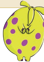
La Famille Cosmic, Ubisoft