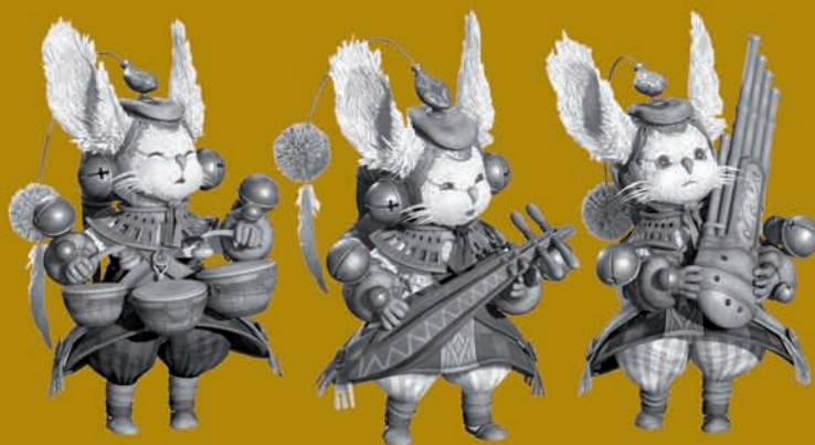
The Legend of Zelda – Twilight Princess, Nintendo

Mais on commence à peine à reconnaître le travail de création graphique et scénaristique, de plus en plus élaboré, qui fait de ces produits de véritables biens culturels.