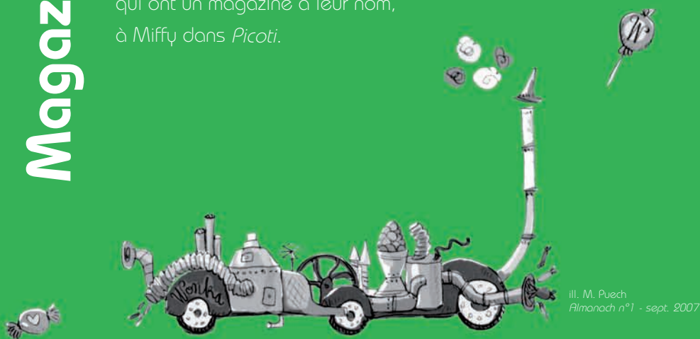
ill. M. Puech Almanach n°1 - sept. 2007

Enfin on note une arrivée massive de héros connus qui s'installent dans les pages des magazines, de Boule et Bill et Mimi qui ont un magazine à leur nom, à Miffy dans Picoti .