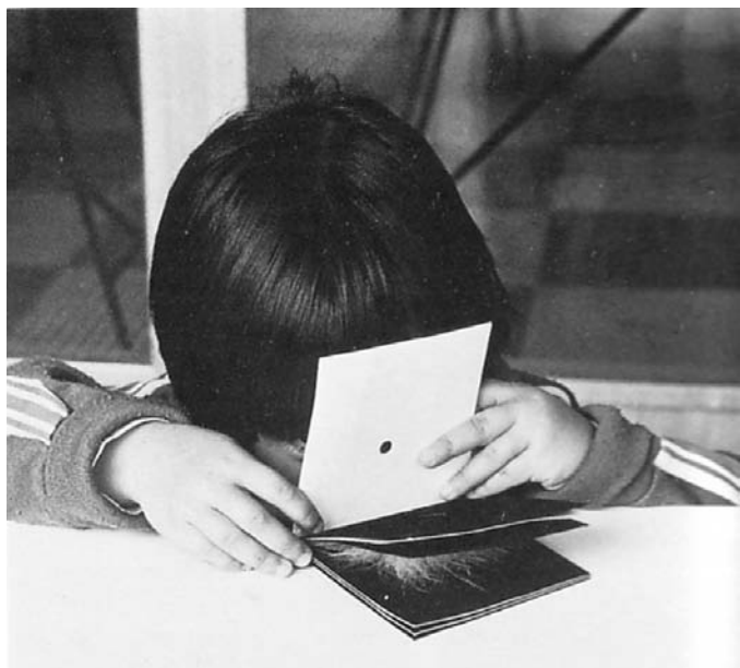
Un enfant et un Prelibre