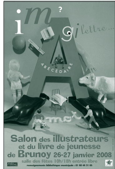
Salon des illustrateurs et du livre de jeunesse de Brunoy

Renseignements : Bologna Children's Book Fair – Piazza Costituzione, 6 – 40128 Bologna – Italie Tél. : +39-051-282361 Fax : +39-051-6374011 Mél : bookfair@bolognafiere.it Site : www.bookfair.bolognafiere.it