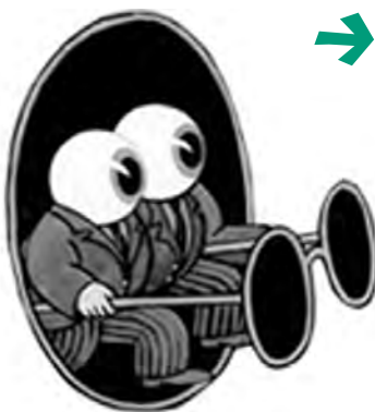
Le Musée Tomi Ungerer à Strasbourg a ouvert ses portes

👉 Les Presses Universitaires de Rennes viennent de réimprimer : L'image pour enfants : pratiques, normes discours . Ce volume, dirigé par Annie Renonciat, a été édité en 2003 par La Licorne, mais il était depuis longtemps indisponible. S'attachant à la création graphique