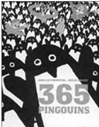
365 pingouins , ill. J. Jolivet, Naïve Prix Libbylit du Salon du livre de Jeunesse de Namur et Prix du jury enfants du Mouvement pour les villages d'Enfants

🕒 Prix 2007 du Salon du livre et de la presse jeunesse de Montreuil :