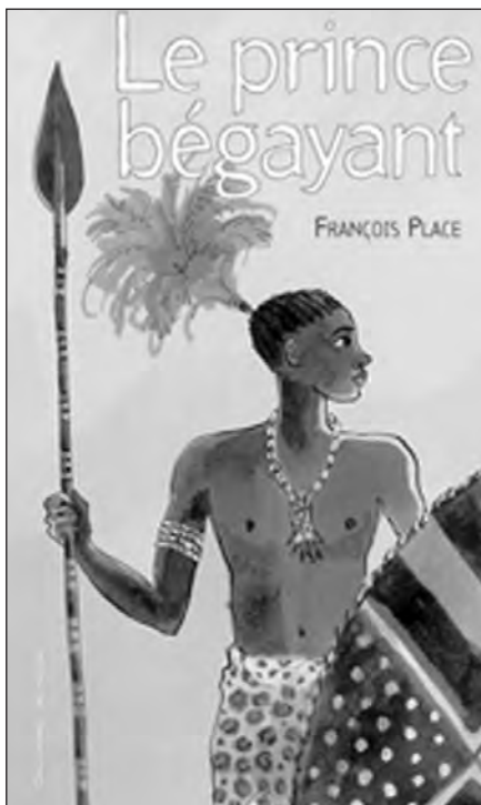
Le Prince bégayant , ill. F. Place, Gallimard Jeunesse Prix Chrétien de Troyes 2007