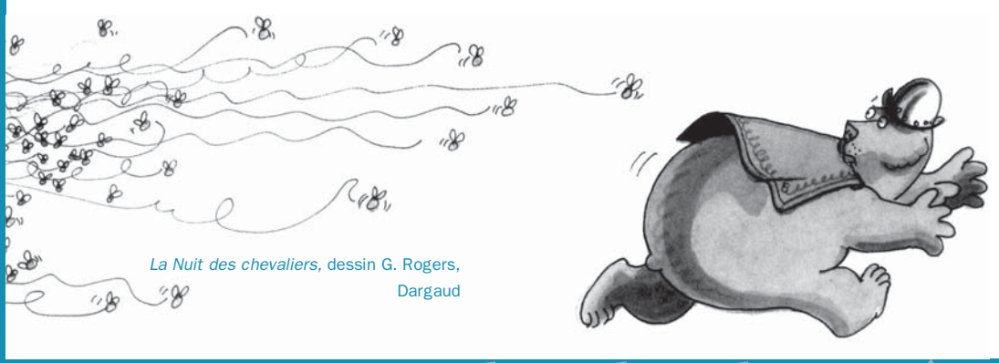
La Nuit des chevaliers, dessin G. Rogers, Dargaud