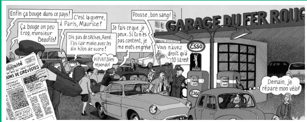
Véro en mai, ill. Y. Pommaux, L'École des loisirs