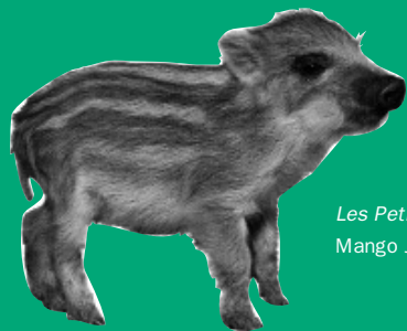
Les Petits d'animaux de la forêt, Mango Jeunesse