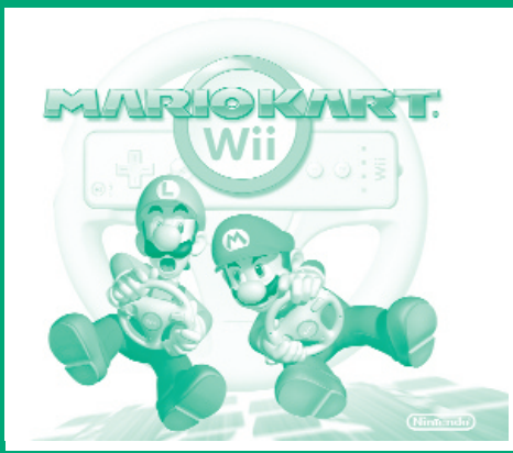
Mario Kart Wii, Nintendo