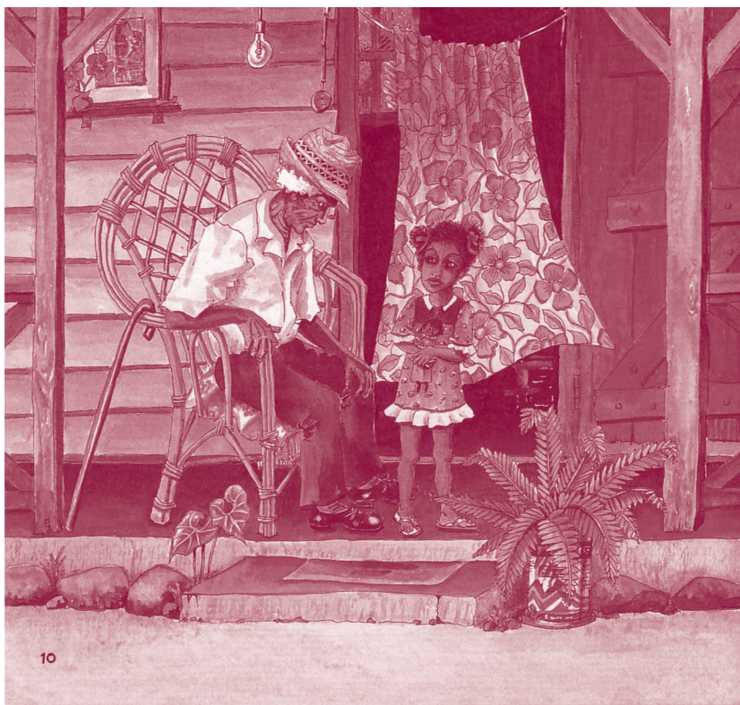
La Tiffi Citronnelle