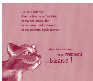
Moi, bizarre ?