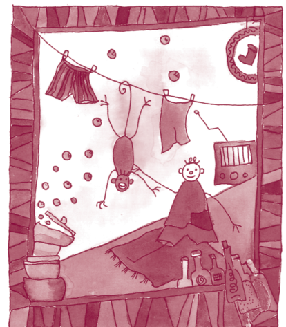
Comme singe et cochon / Konm sousou èk la mori