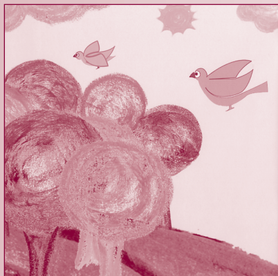
[Toutou et le soleil] توتو والشمس

[SUCRE OH SUCRE] سكره يا سكره Nourchane Al-Jawwadi ; ill. Wafa' Ben Ramadan.-