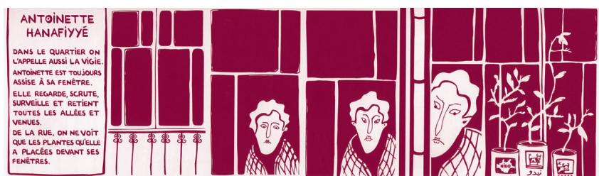
38, rue Youssef Semaani

Ce récit se déroule durant la guerre du Liban (1975-1990). Samy raconte le quotidien de la guerre, les jours passés au sous-sol, dans l'abri aménagé par sa mère pour garder un semblant de normalité à l'existence. Durant les rares moments d'accalmie, la population se rue à l'air libre, et essaie de profiter au maximum de la vie. Samy a perdu son père dans la guerre, il lui manque ainsi qu'aux autres membres de la famille.