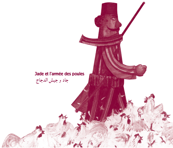
Jade et l'armée des poules جاد و جيش الدجاج

Cette bibliographie sélective propose des titres en français, en arabe ou bilingues, publiés dans le Monde Arabe ou en France. Une sélection difficile, vu la richesse et la qualité de la production pour la jeunesse dans les pays arabes, notamment en ce qui concerne les albums. Ces publications obtiennent une reconnaissance internationale, à la Foire internationale du livre pour enfants de Bologne par exemple.