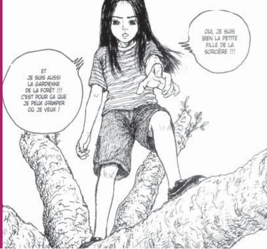
La Forêt de Miyori, ill. H. Oda, Milan