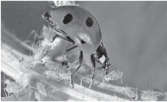
Le Jardin, Mango Jeunesse