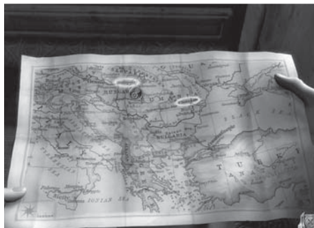
Dracula 3 : La Voie Du Dragon, Kheops Studio / Microïds