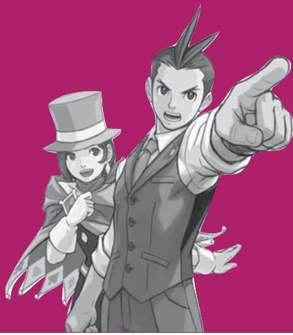
Apollo Justice : Ace attorney, Capcom