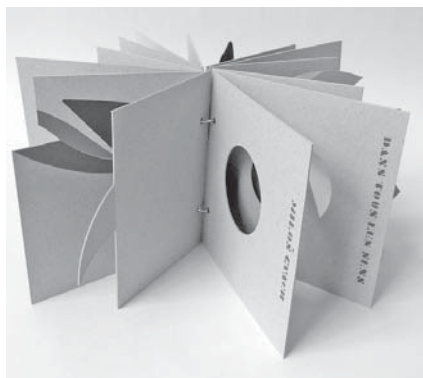
Dans tous les sens, Milos Cvach, 2008