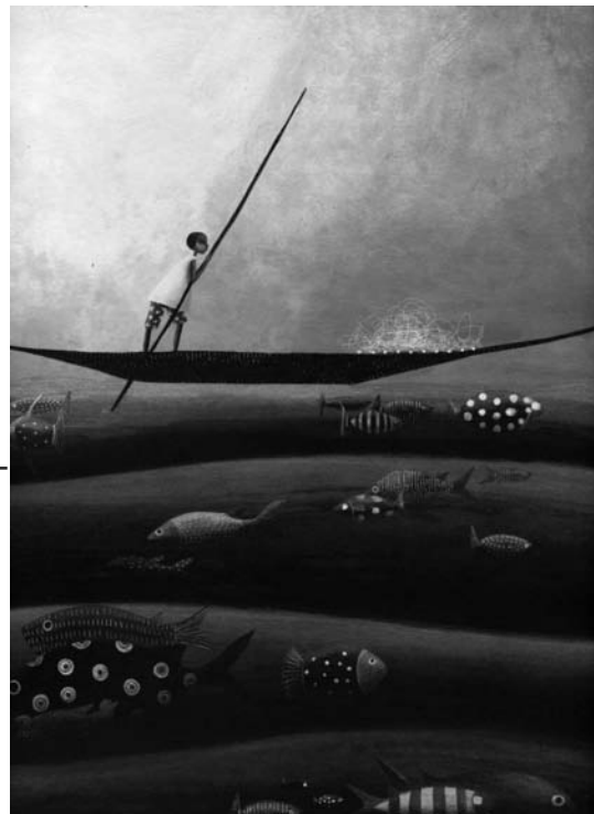
Le Voyage du poisson