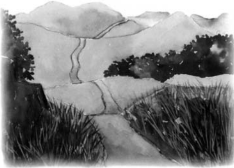
Notre imagier / Ny bokintsarintsika

Dans le numéro précédent, Takam Tikou consacrait son dossier central aux îles de l'Océan Indien et proposait une large sélection d'ouvrages. Voici un choix parmi les nouveautés parues depuis lors, qui confirment la vitalité de l'édition jeunesse dans la région.