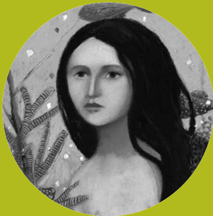
La Petite sirène, ill. N. Novi, Didier Jeunesse