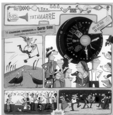
C'est de famille ! , ill. M. Le Huche, Milan Jeunesse