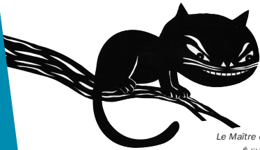
Le Maître de tout, ill. K. Matthys, Éditions du Rouergue

Recension et analyse de 280 nouveautés de l'édition jeunesse, classées par genres : livres d'images, contes, poésie, livres CD, théâtre, textes illustrés, premières lectures, romans, bandes dessinées, documentaires, multimédia, magazines pour enfants.