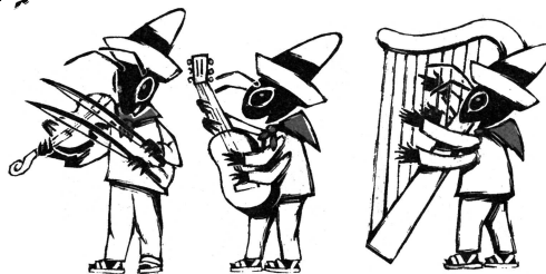
La Cucaracha, ill. Fabricio Vanden Broeck, Camelia ediciones/Ediciones Telocote, 2008