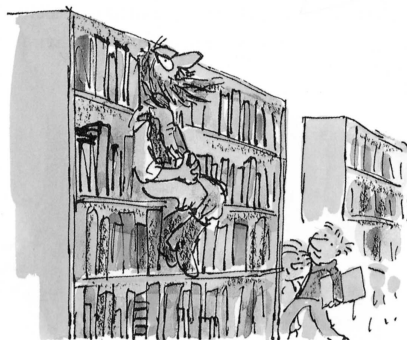
L'Enlèvement de la bibliothécaire, ill. Q. Blak, Gallimard Jeunesse

Événements, rencontres, réflexions sur les pratiques professionnelles.