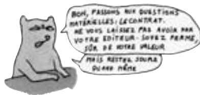
Comment faire des livres pour enfants, ill. Nadja, Éditions Cornélius