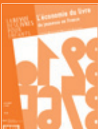
Illustration d'Anne Bertier, extraite de Chiffres cache-cache , publié chez MeMo, reproduite avec l'aimable autorisation des éditions MeMo.