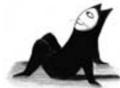
Alors ?, ill. K. Crowther, L'École des loisirs / Pastel

Événements, rencontres, réflexions sur les pratiques professionnelles.