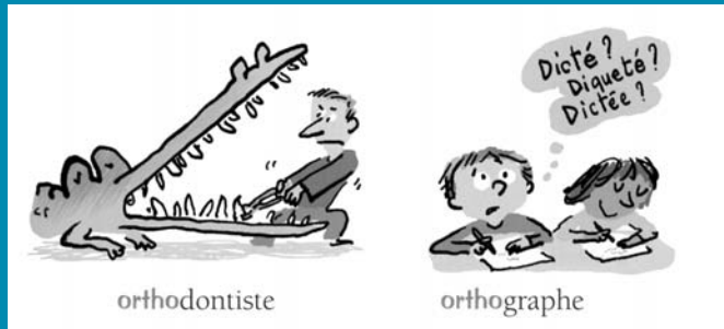
Ces petits mots qui font les grands , ill. Robin, Éditions du Temps