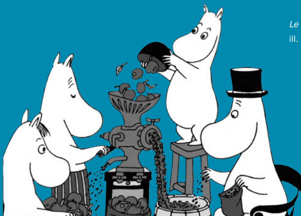
Le Livre de cuisine des Moomins, ill. T. Jansson, Le Lézard noir