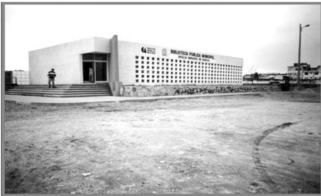
Bibliothèque Centrale, Huichapan, Hidalgo