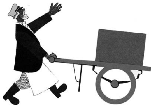
« La Glace », ill. extraite de Quand la poésie jonglait avec l'image , de S. Marchak, ill. V. Lebedev, MeMo