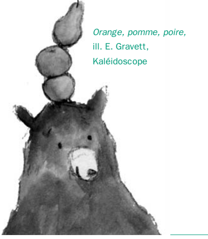
Orange, pomme, poire, ill. E. Gravett, Kaléidoscope