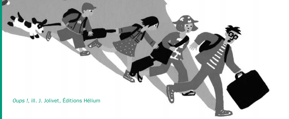
Oups !, ill. J. Jolivet, Éditions Hélium