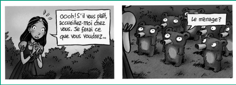
La Belle aux ours nains, ill. É. Bravo, Seuil Jeunesse