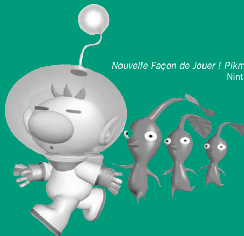
Nouvelle Façon de Jouer ! Pikmin 2, Nintendo

nous partons à la recherche de trésors du patrimoine mondial, dérobés par la célèbre Carmen Sandiego. Du Japon à l'Europe en passant par l'Inde ou les États-Unis, il va falloir mener l'enquête, trouver les indices, et tenter de devancer le prochain vol. Les phases de « pointez-cliquez » pour trouver les indices, se mélangent à des casse-tête et autres énigmes qui captivent jusqu'à l'issue de l'aventure. Difficile de savoir à qui s'adresse un titre, qui frustrera les fans de la première heure par un manque d'ambition, de renouveau, et une faible durée de vie, et qui intriguera un nouveau public peu habitué à ce genre quelque peu rétro, mais non dénué de charme et d'intérêt. Ce serait dommage de passer à côté de cet agréable moment et de se priver des précédents opus. (C.B.)