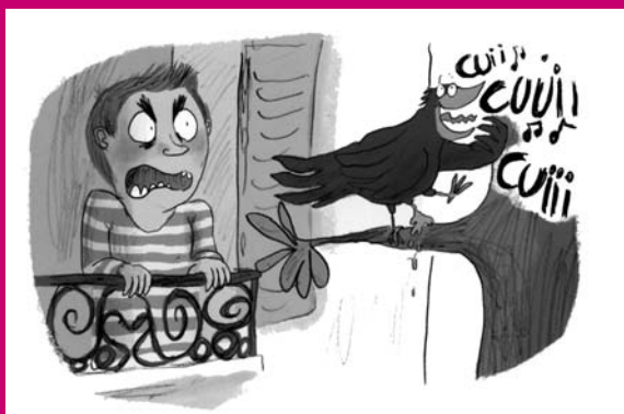
Bas les pattes ! , ill. R. Garrigue, Milan Jeunesse