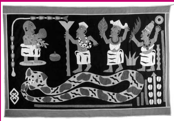
L'Océan noir, ill. W. Wilson, Gallimard Jeunesse / Giboulées