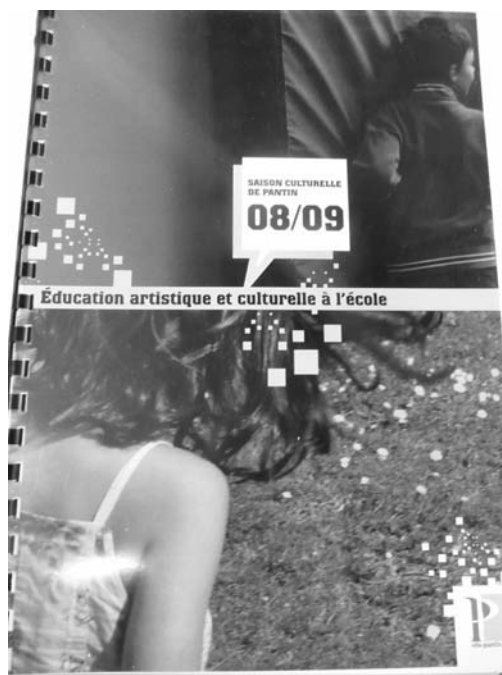
La plaquette portail des actions municipales à l'école

Présenter des livres aux enfants est, certes, l'action-clé des bibliothécaires mais s'adresser aux adultes, non seulement comme médiateurs mais comme lecteurs, est tout aussi important : la bibliothèque est aussi un lieu qui accueille des adultes, parents, enseignants, animateurs, partenaires sociaux et culturels, professionnels de la petite enfance... et, depuis quatre ans, les nouveaux enseignants viennent à la rentrée à la bibliothèque avec le conseiller pédagogique pour une visite découverte. Le « portail » a permis de construire un partenariat durable et de conforter des actions culturelles (actuellement 60 % des classes